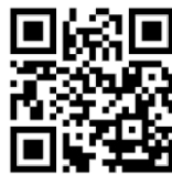
携帯電話読取 QRコード